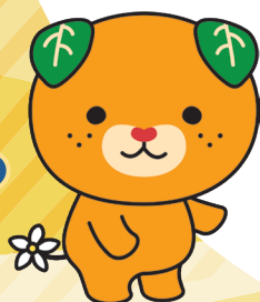
愛媛県イメージアップキャラクター みきちゃん