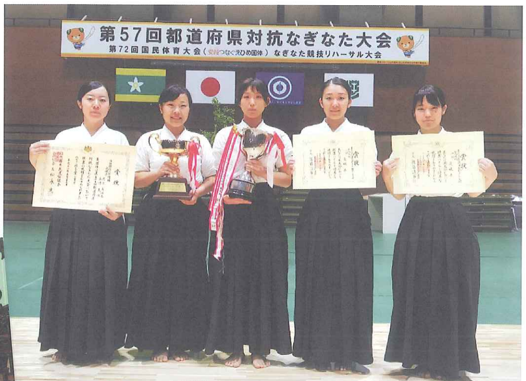
松山市総合コミュニティーセンターにて左から 氏名 (勤務地)