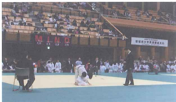
▲NHK松山放送局長杯 第43回愛媛県少年柔道錬成大会の様子