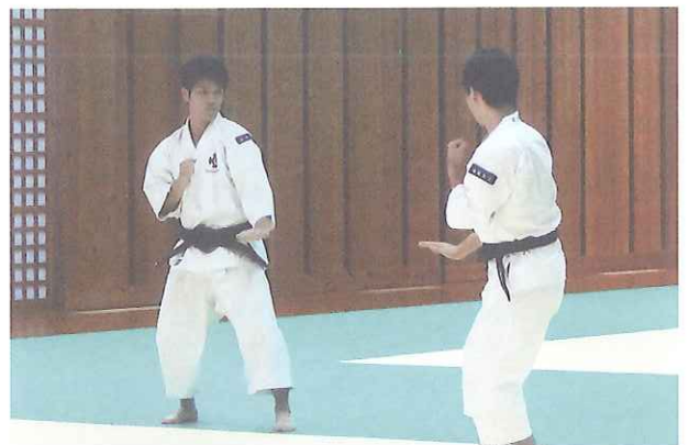
講座での指導風景