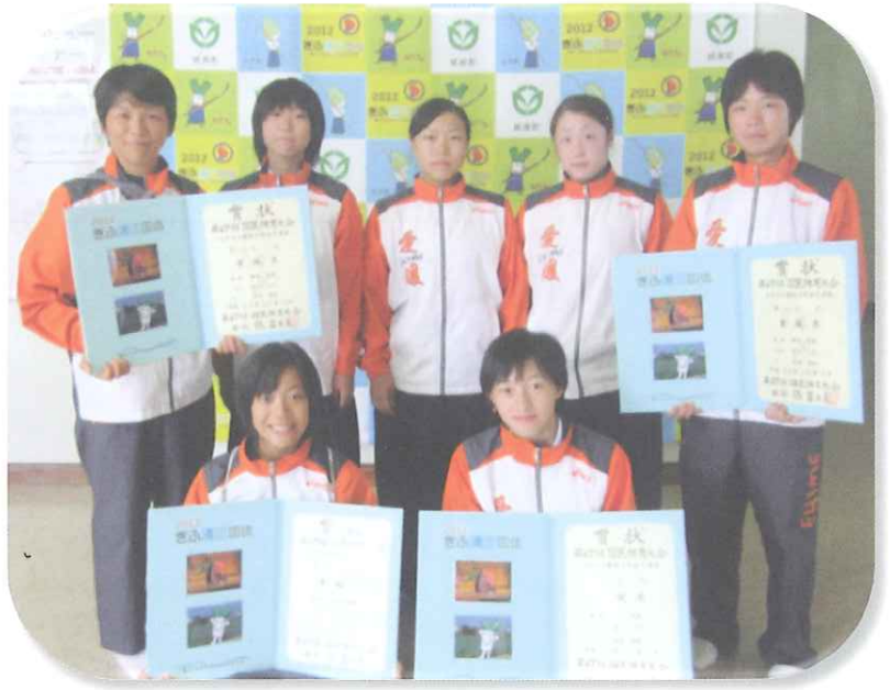
国体成年・少年メンバーと監督

次に、成年演技競技については、今までの練習の成果は出せたものの、1 回戦の新潟戦で惜敗してしまいました。試合競技については、1 回戦の徳島戦で勝利したものの、2 回戦の沖縄戦では、本県の持ち味である若さある粘りの動きに精彩を欠き、敗北を喫してしまいました。今回の国体では沢山の課題が見つかりましたが、5 年後のえひ