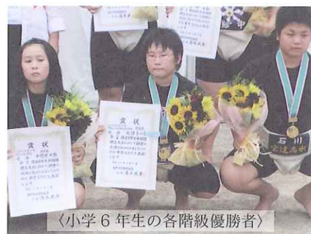
〈小学6年生の各階級優勝者〉

本人は不安で仕方がなかったようですが、「やればできる！」ということに気がつき、自信も深まったと思います。