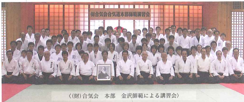
〈(財)合気会 本部 金沢師範による講習会〉

愛媛県合気道連盟は、財団法人合気会の設立趣旨に賛同する団体で組織し、愛媛県合気道の総合的な窓口並びに推進機関として、加盟団体の取りまとめとレベル向上対策事業や会員拡充事業などを実施し、県内合気道の振興を図っています。年間行事と加盟道場はホームページ ( http://www.e-aikiren.com/ ) に掲載してありますので、ご覧ください。